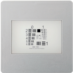
SilverFast 35mm Resolution-Target (USAF 1951)

Weitere Informationen zu den SilverFast Resolution-Targets (USAF 1951) sowie eine ausführliche Anleitung, zusätzliche Verwendungszwecke und Hintergründe finden Sie unter: www.SilverFast.de/Resolution-Target