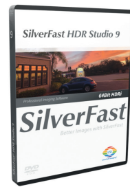
SilverFast HDR Studio