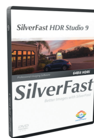
SilverFast HDR Studio