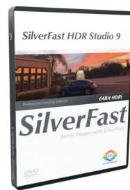
SilverFast HDR Studio